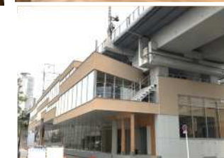
【内装木質化】名古屋ビルディング桜館 【木造】ささしま高架下オフィス (2021年度木の香る都市づくり事業活用施設) (2021年度木の香る都市づくり事業活用施設)