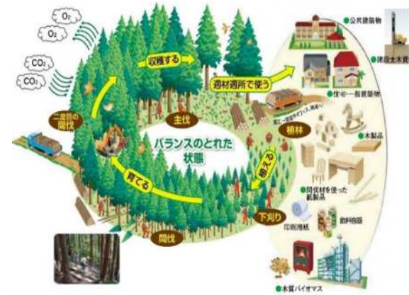
森林資源の循環利用のイメージ(資料:森林・林業白書)

燃やさない限り木材から放出されませんので、 木材の利用は、大気中の二酸化炭素を減らすことにつながります。