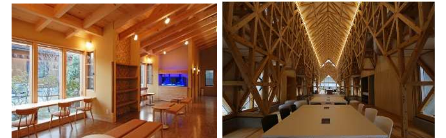
【木造】くらしの杜クリニック(岡崎市) 【木造】リモテラス公益施設(長久手市)