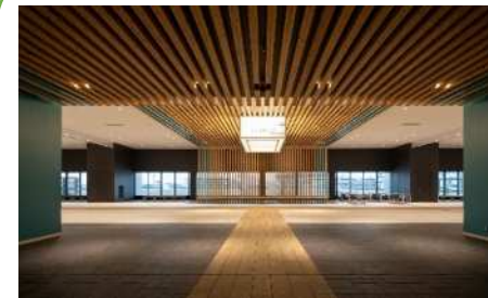
【内装木質化】Aichi Sky Expo (愛知県国際展示場)