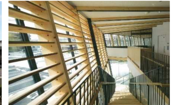
【内装木質化】 岡崎信用金庫 城下町支店（第1回木づかい表彰 優秀賞）