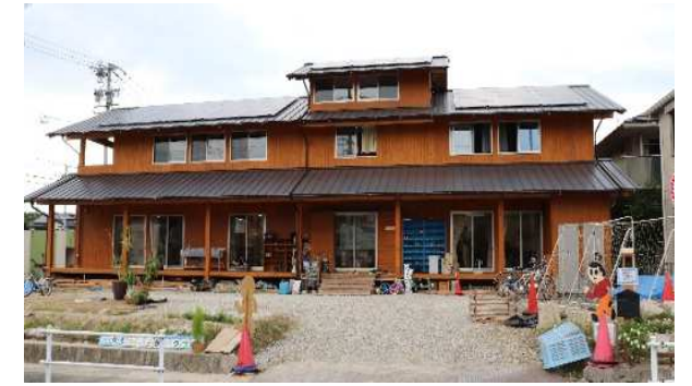
【木造】 あおぞら学童保育クラブ(名古屋市)

健康的で快適なオフィスでは職員・スタッフの生産性の向上が期待され、働き方改革にも貢献します。