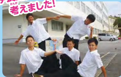
協力：福江高等学校