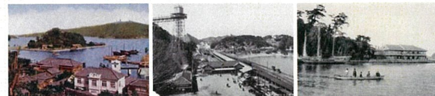
錦城夕照・相島秋月(山本実コレクション) 日和山春景・佐田落雁(山本実コレクション) 樋の山青嵐・赤崎帰帆(鳥羽港赤崎社前待月樓及び遊覧舟)

☎0599-25-2028 クーポン 伊勢湾フェリー乗船券の半券と巻末のクーポン券をお持ちいただいた方に入場料 大人250円、小人120円を割引いたします。